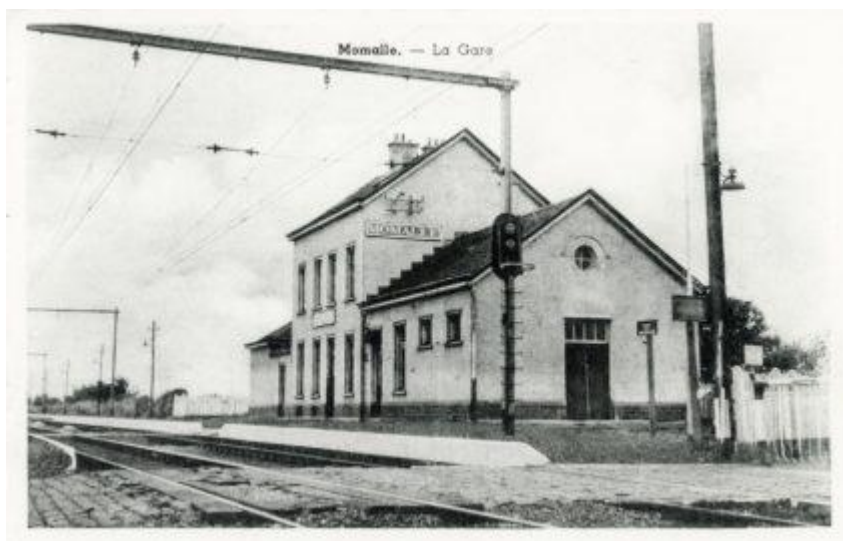
Halte de Momalle