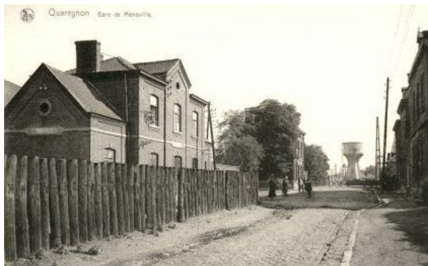
Gare de Monsville