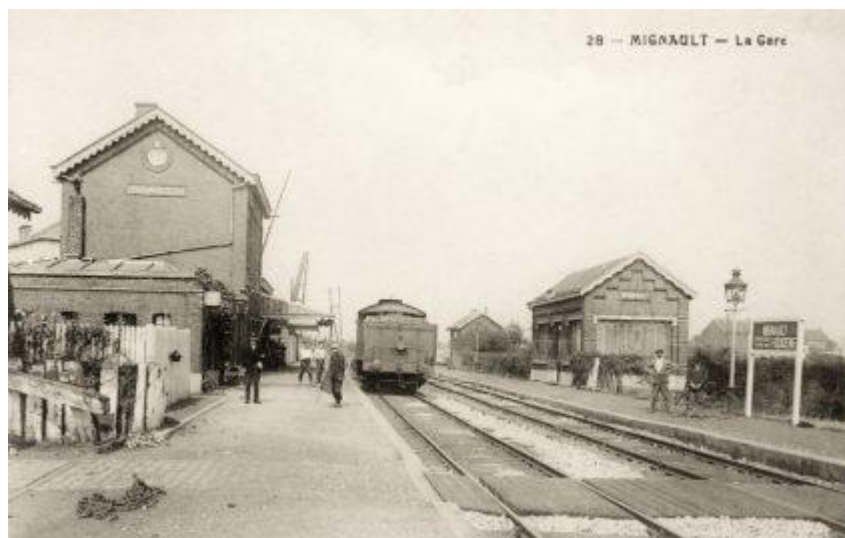
Gare de Mignault