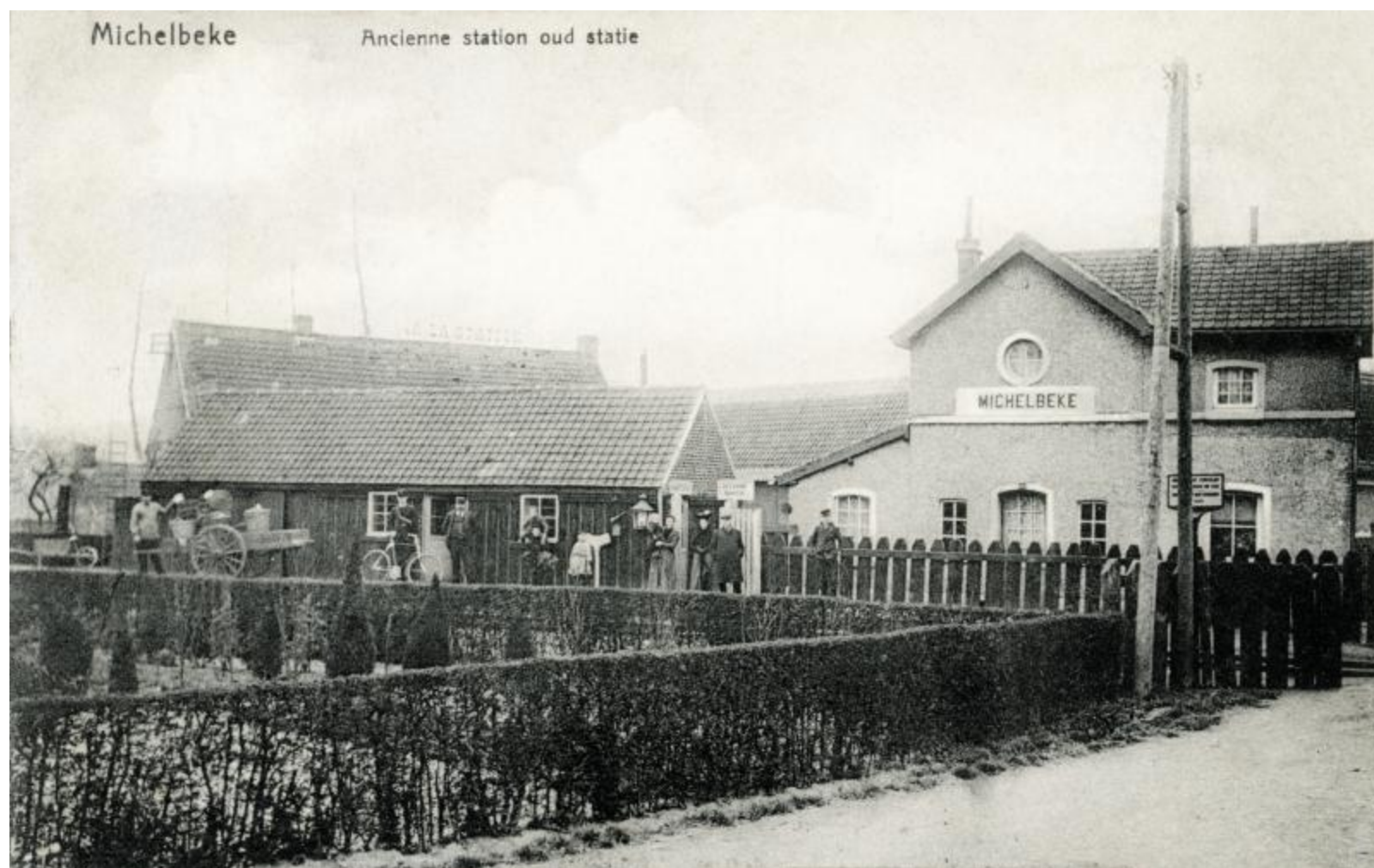
Halte de Michelbeke