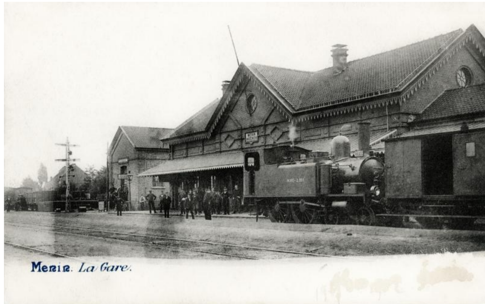
Gare de Menin - Menen station