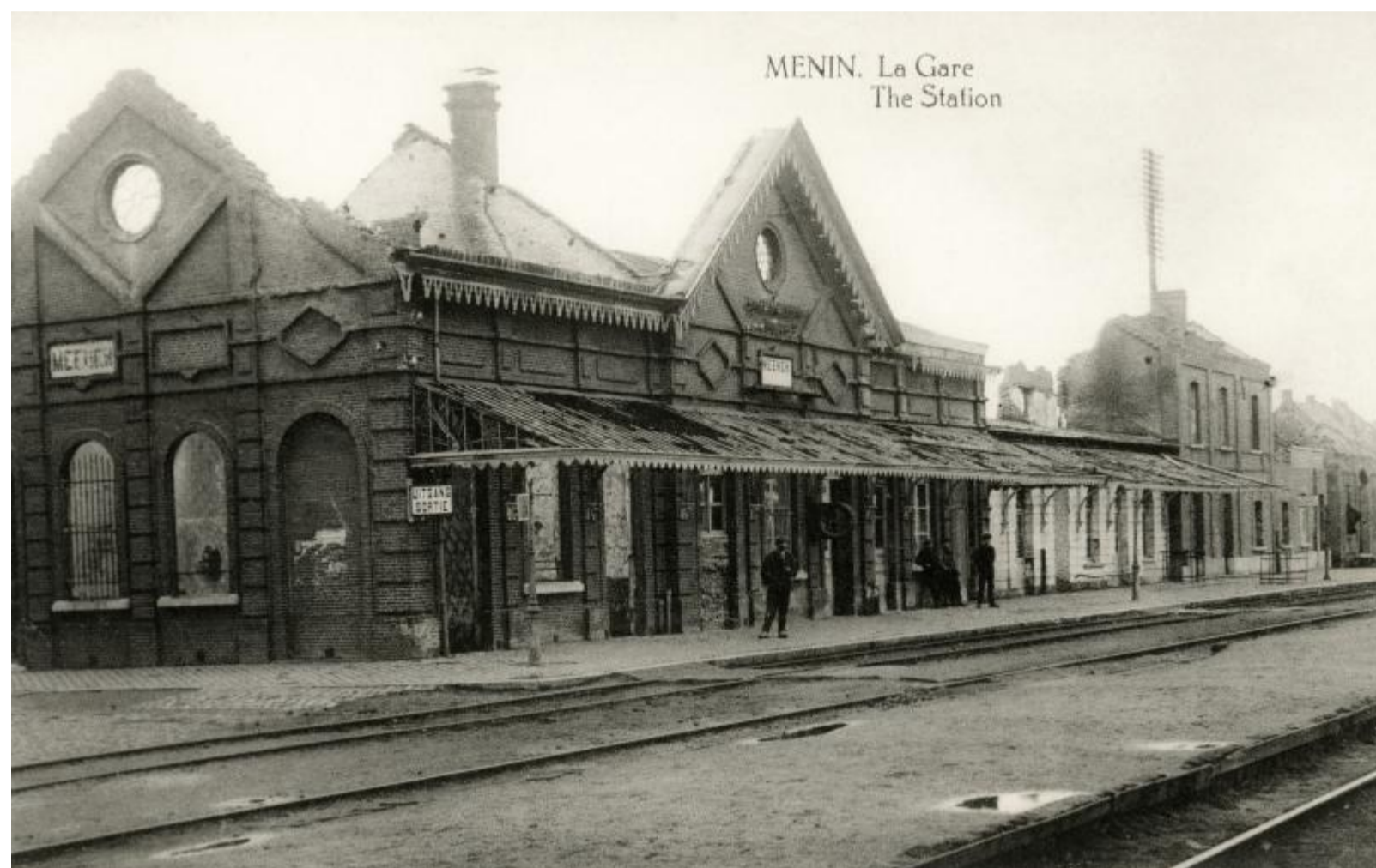
Gare de Menin - Menen station