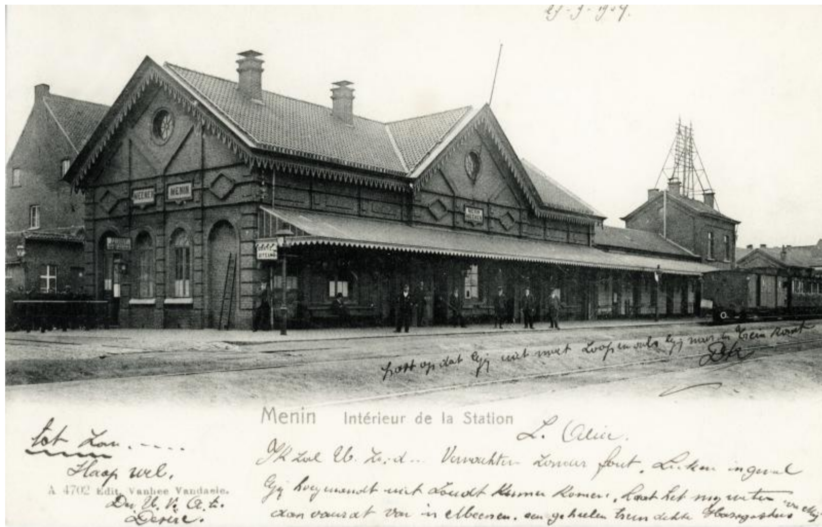
Gare de Menin - Menen station