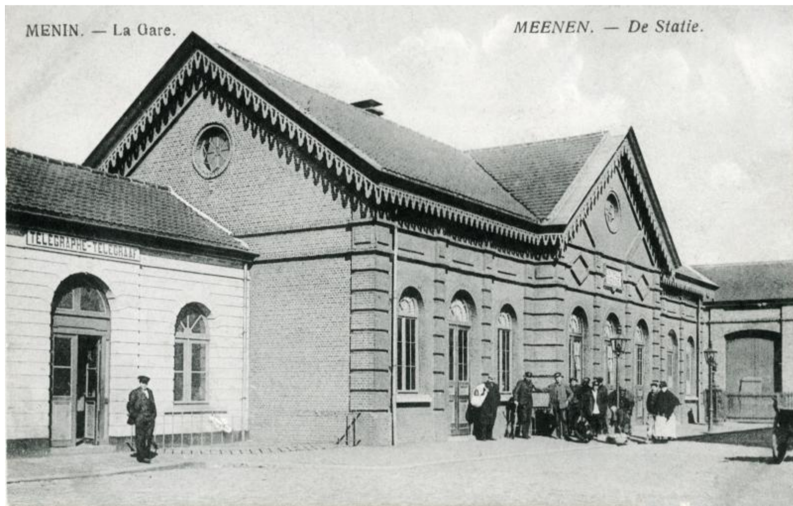
Gare de Menin - Menen station