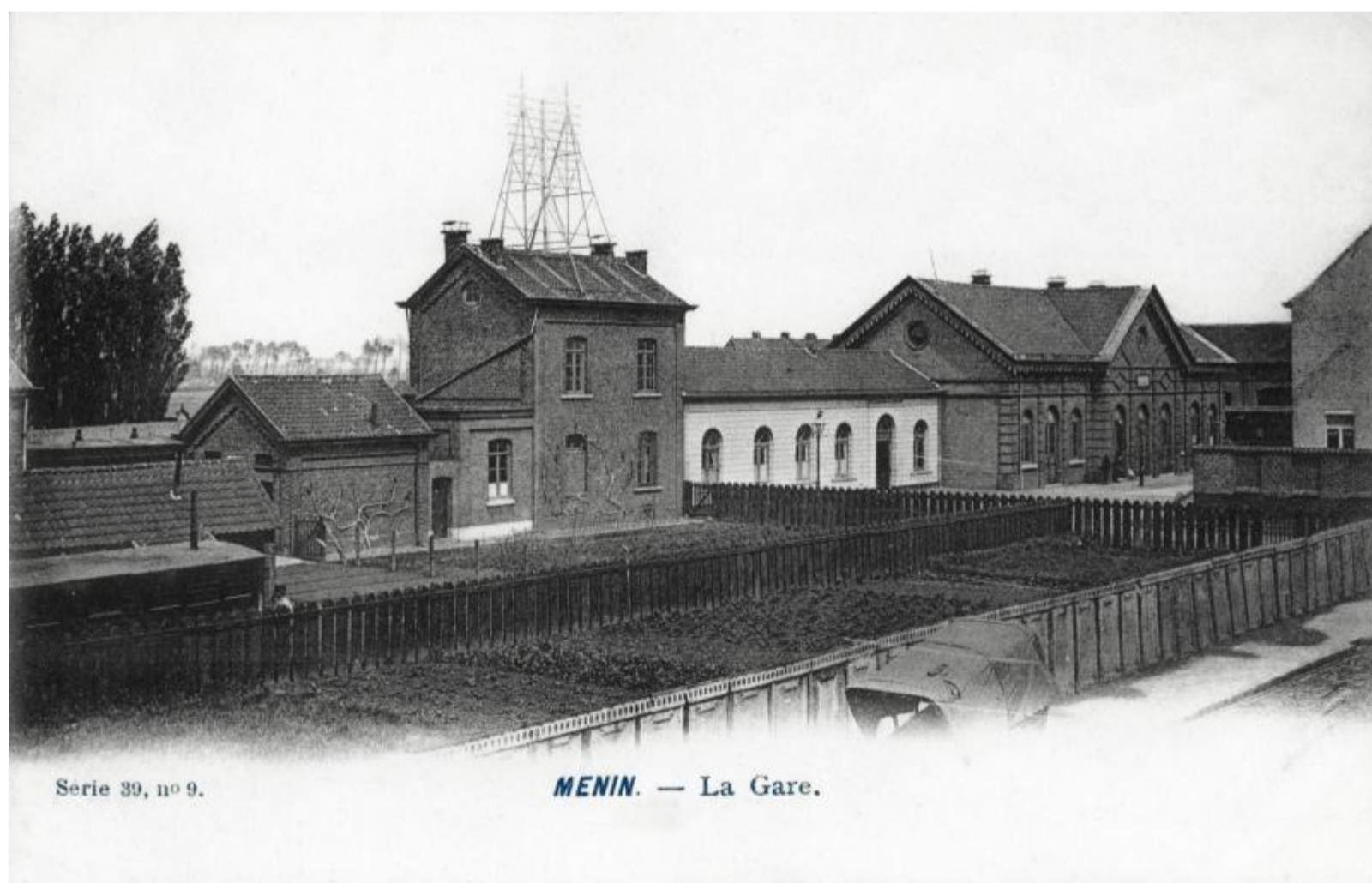
Gare de Menin - Menen station