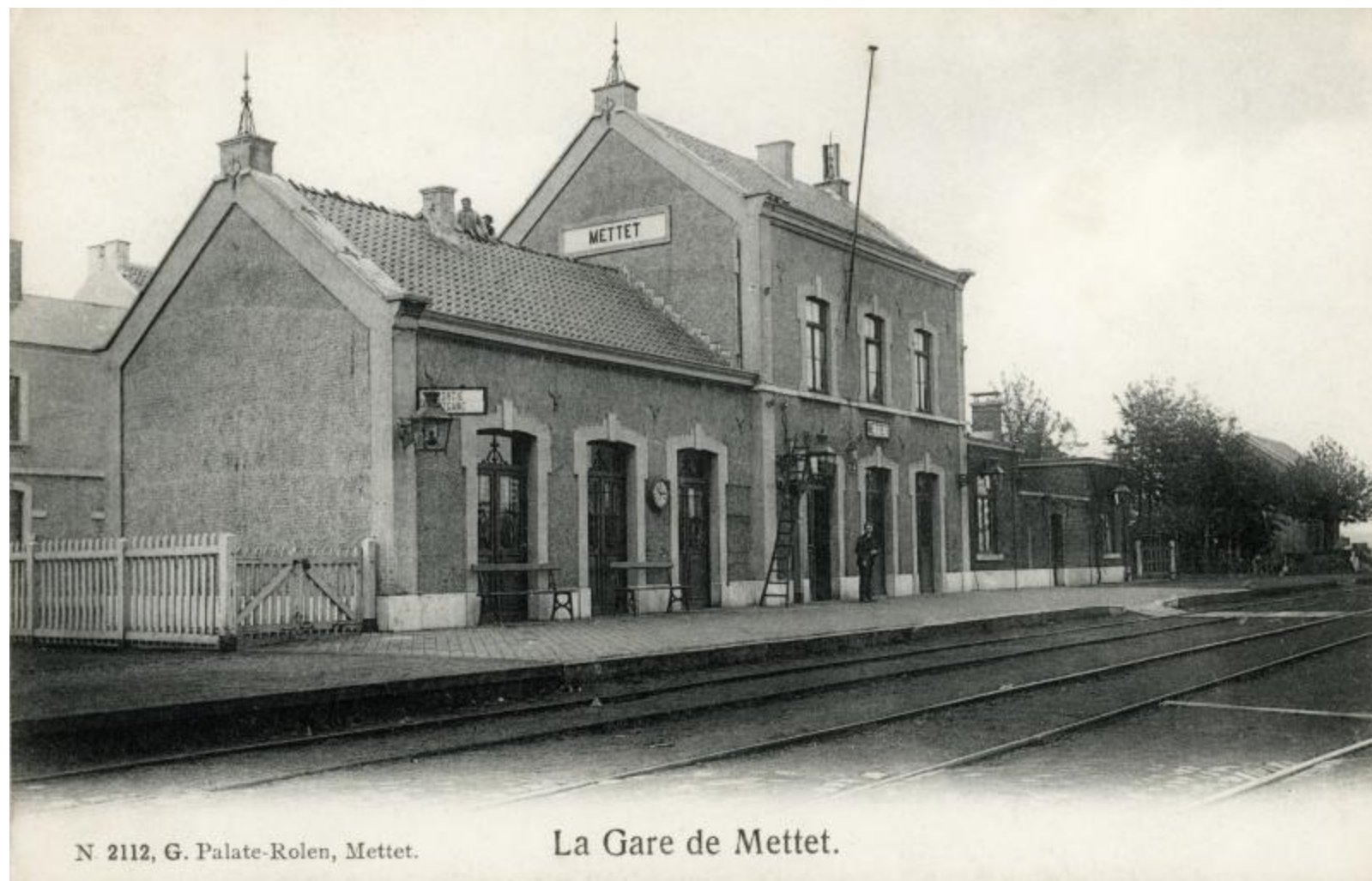
Gare de Mettet