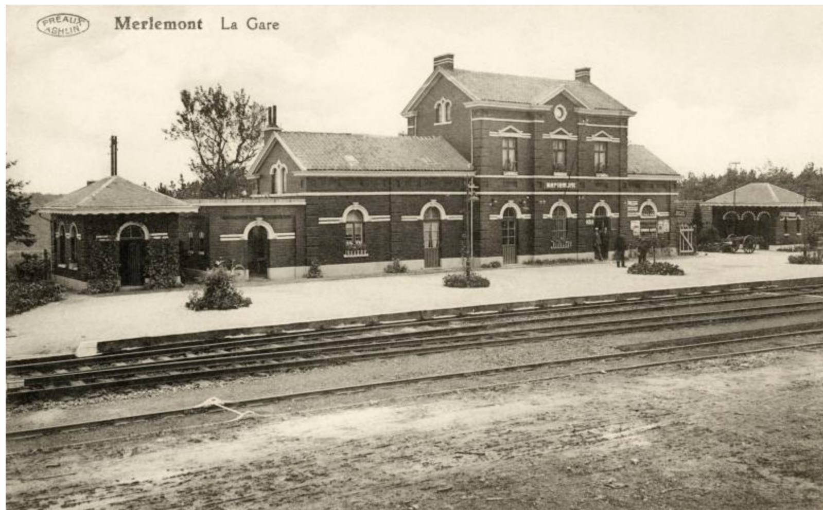
Halte de Merlemont

Horaire 1897 (Montigny-sur-Sambre) : ligne 145