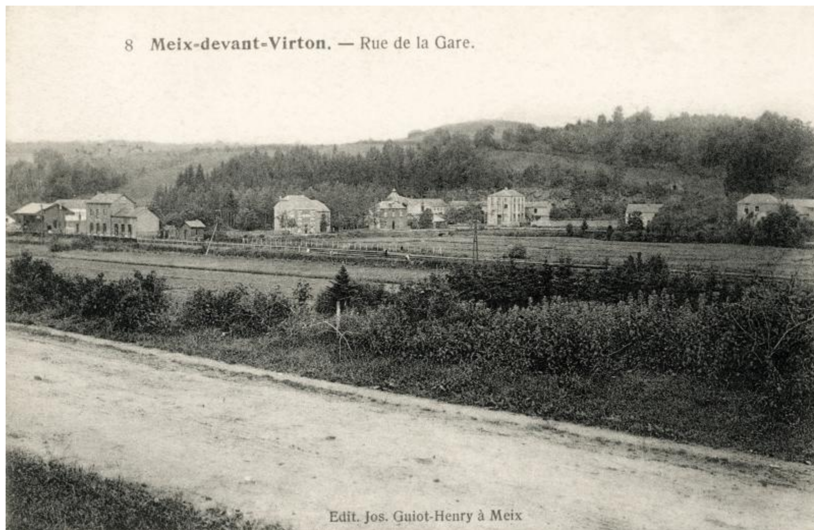
Gare de Meix-devant-Virton