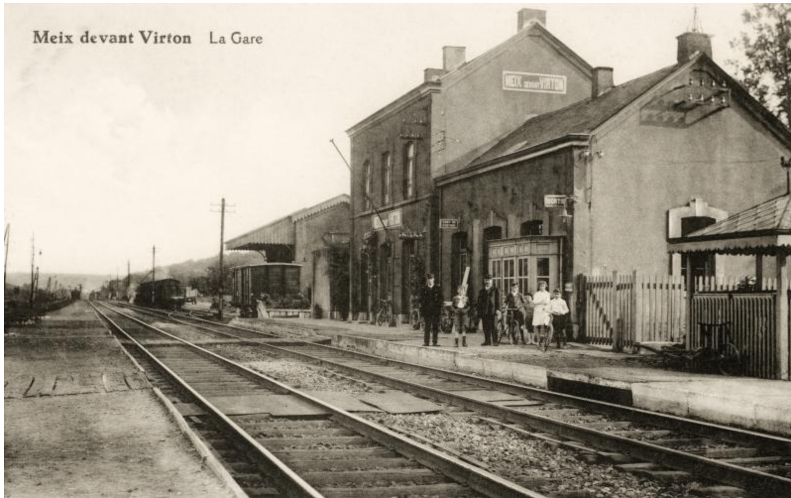
Gare de Meix-devant-Virton