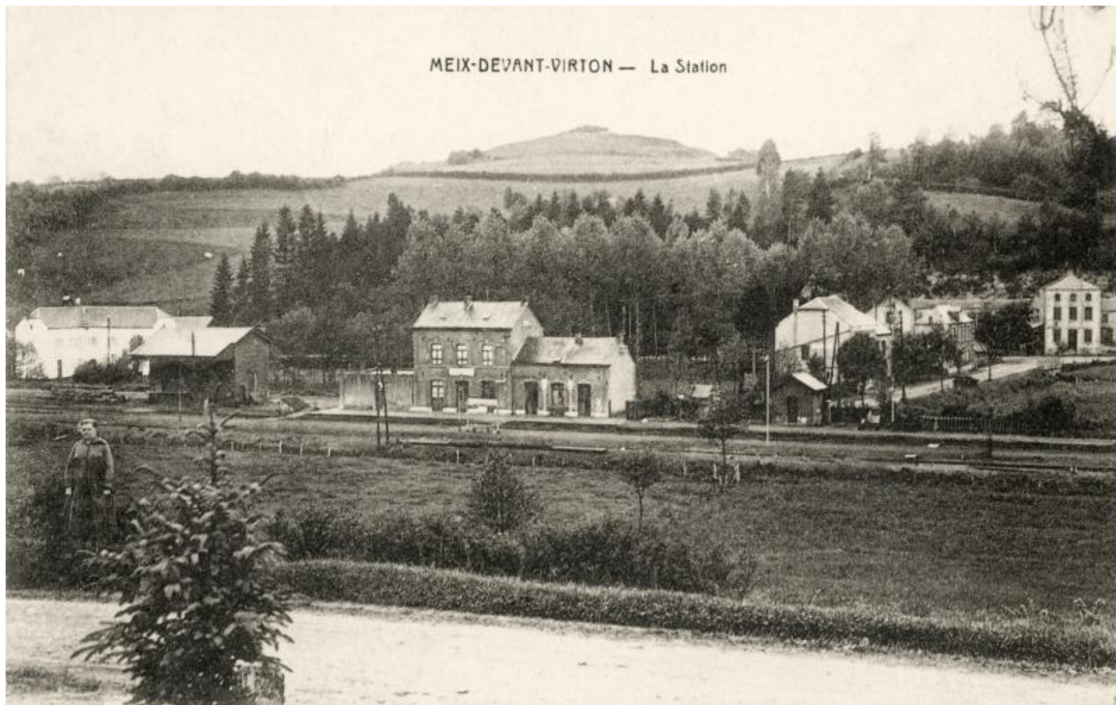
Gare de Meix-devant-Virton