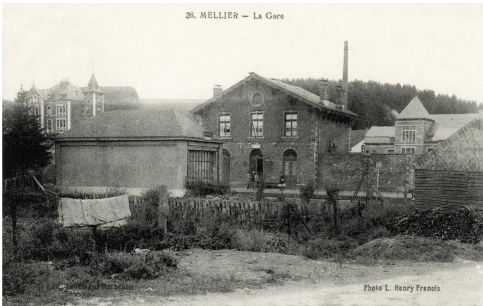
Gare de Mellier