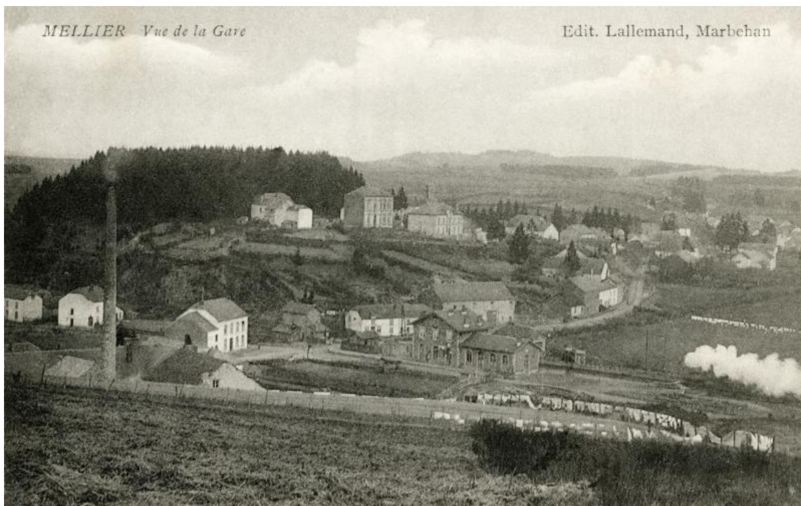
Gare de Mellier