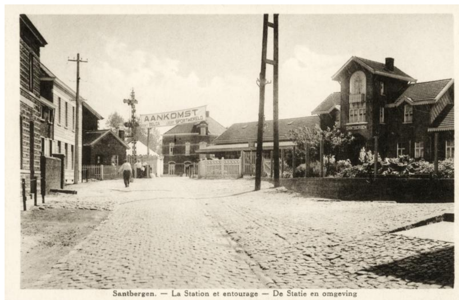
Gare de Zandbergen - Zandbergen station