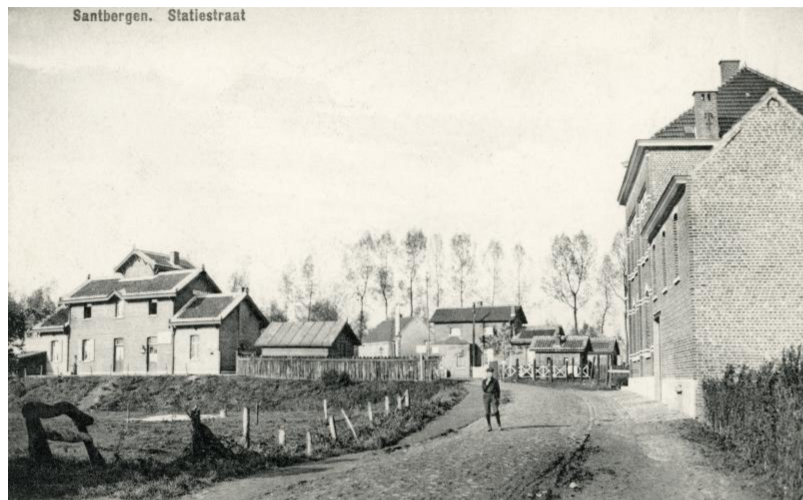
Gare de Zandbergen - Zandbergen station