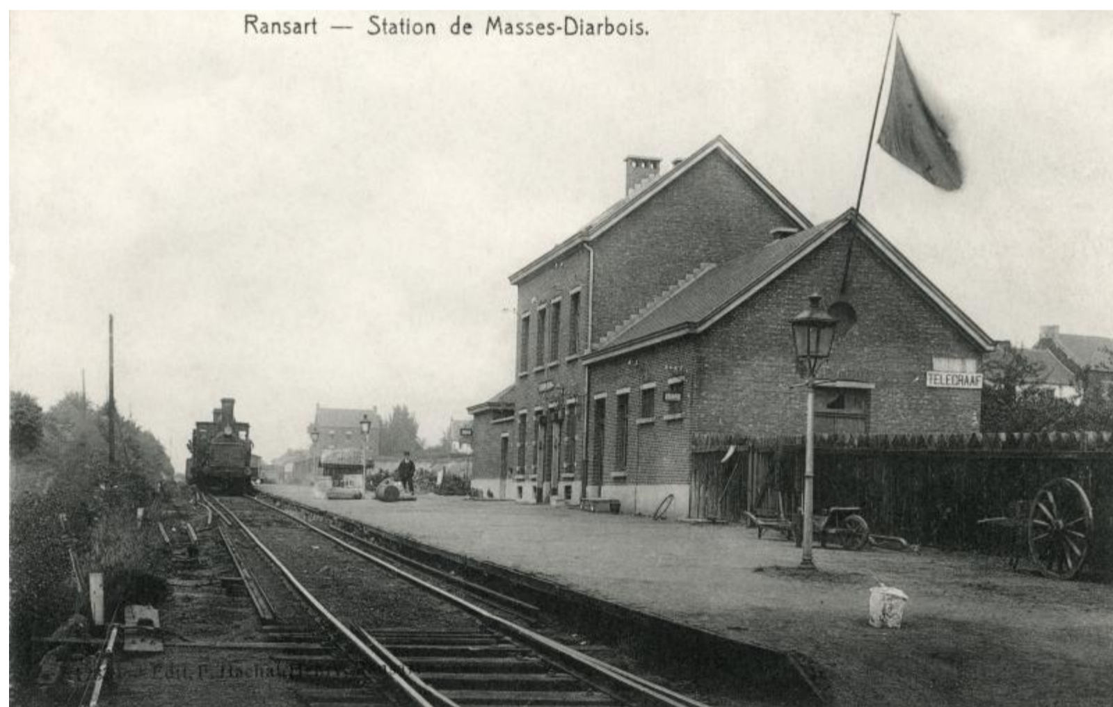
Halte de Masses-Diarbois