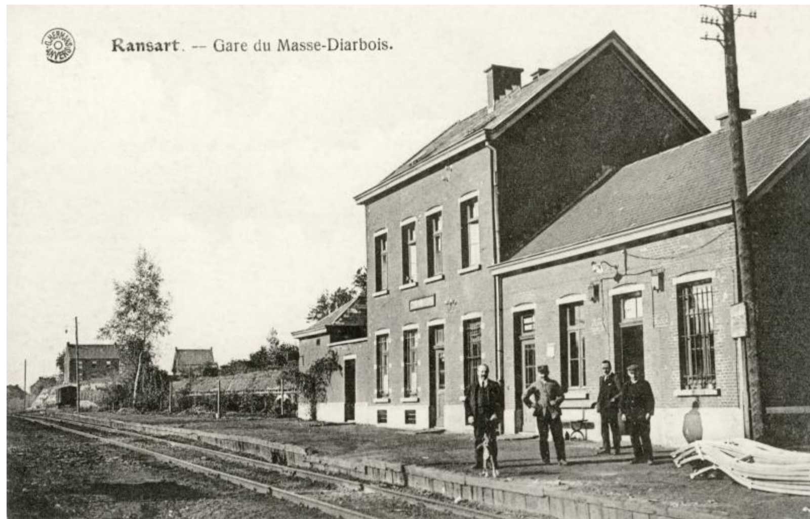
Halte de Masses-Diarbois