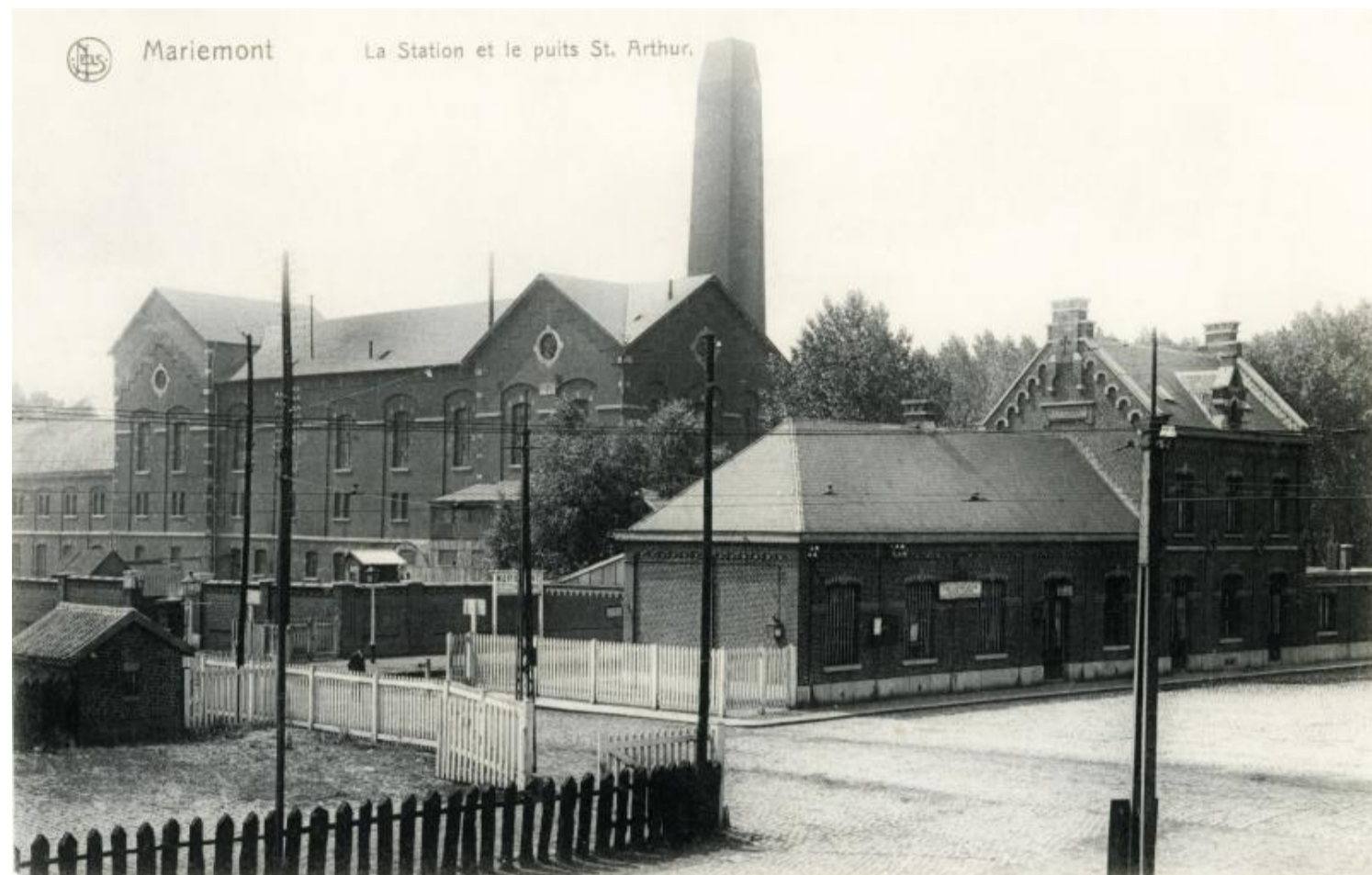
Gare de Mariemont