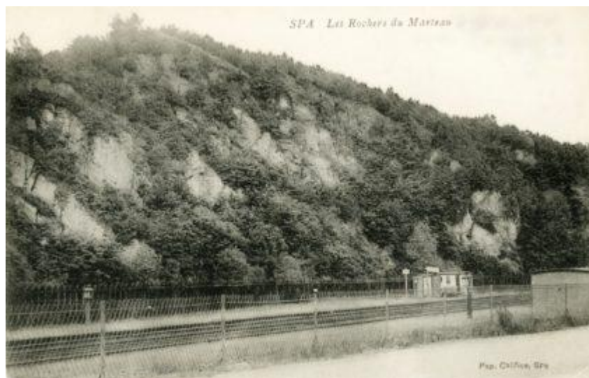
Point d'arrêt du Marteau