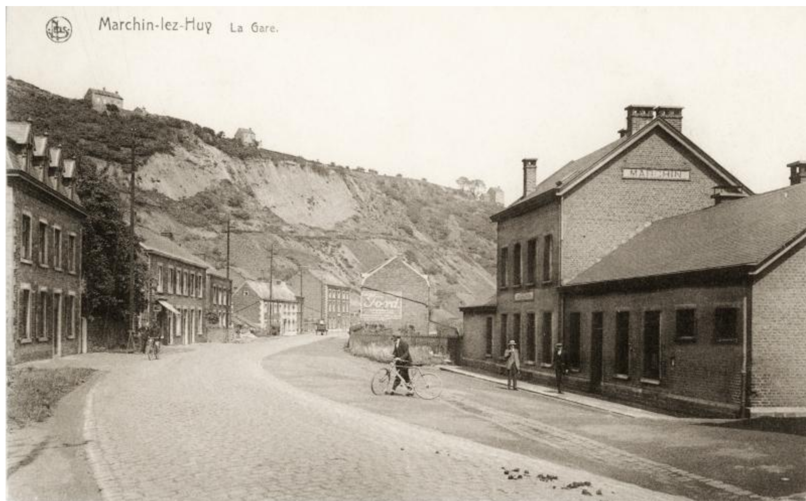
Halte de Marchin