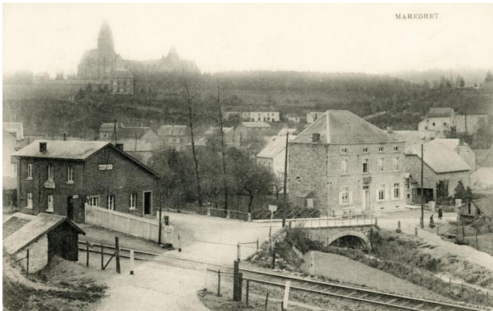
Halte de Maredret