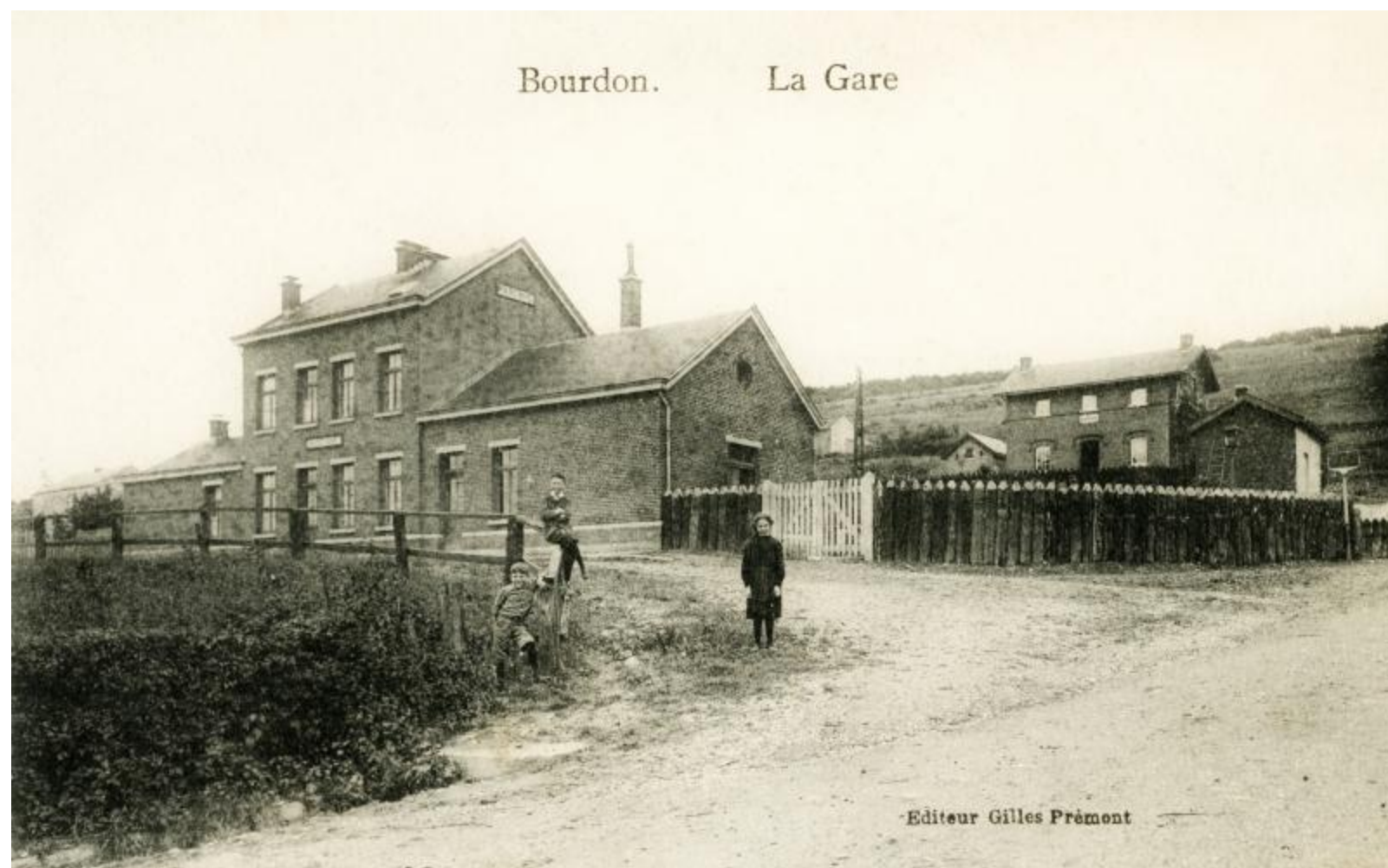
Halte de Marenne