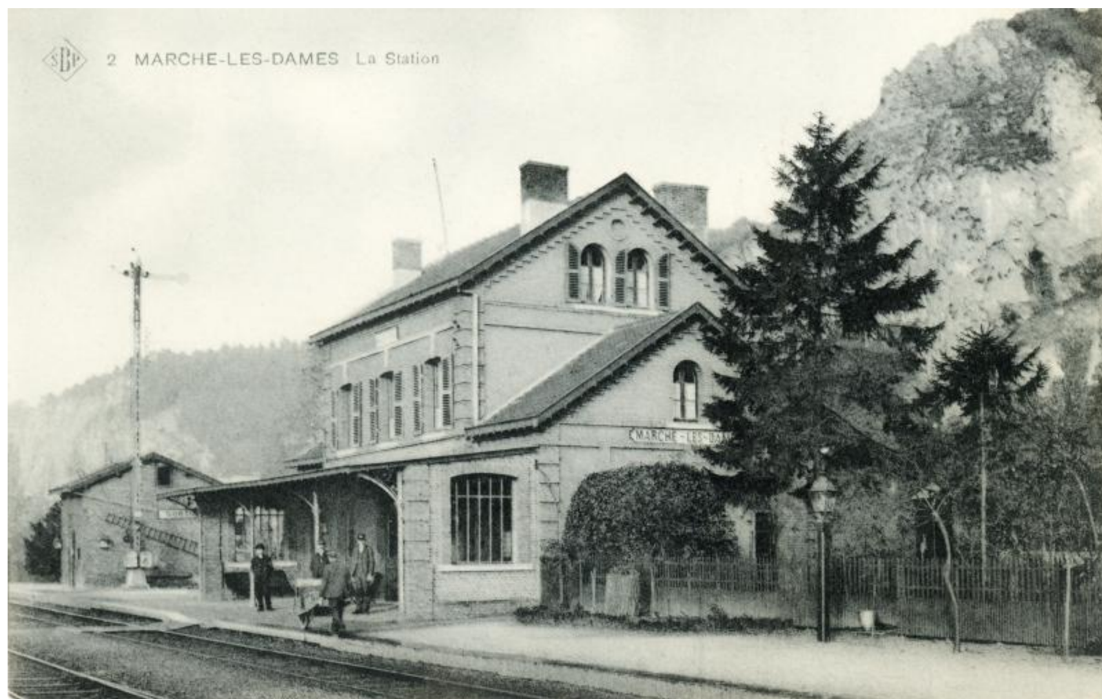
Gare de Marche-les-Dames