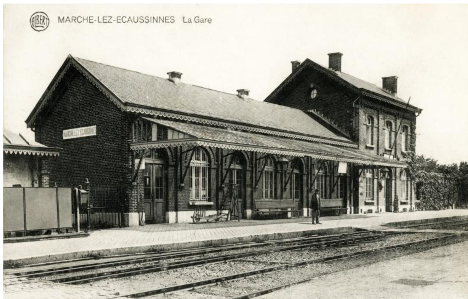
Gare de Marche-lez-Ecaussinnes

Horaire 1897 (Marche-lez-Ecaussinnes) : ligne 128 Horaire 1913 (Marche-lez-Ecaussinnes) : ligne 123 Horaire 1933 (Marche-les-Ecaussinnes) : ligne 123 Horaire 1937 (Marche-lez-Ecaussinnes) : ligne 123 Horaire 1949 (Marche-lez-Ecaussinnes) : ligne 117 Horaire 1958 : ligne 117 Horaire 1961 : ligne 117 Horaire 1971 : lignes 108 – Bus : 107 – 864 Horaire 1978 : lignes 108 – Bus : 107a – 864 Horaire 1980 : lignes 108 – Bus : 107a – 864 Horaire 1984 IC-IR : ligne 54 Horaire 1990 : ligne 108 Horaire 1999 – 2000 : ligne 108 Horaire 2018 : ligne 108