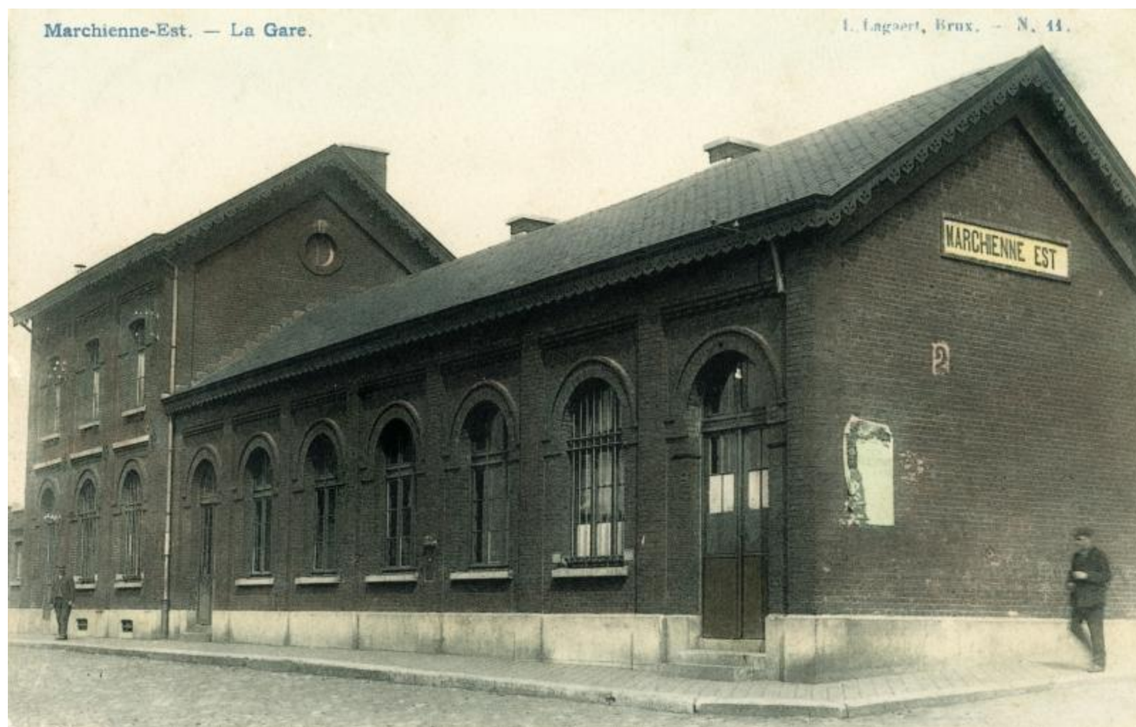
Gare de Marchienne Est

Horaire 1897 : lignes 124 - 125 - 128 - 134 - 135