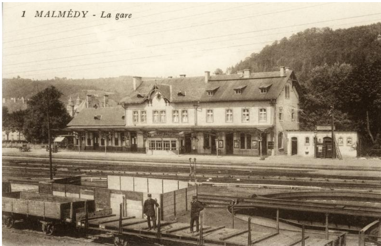
Gare de Malmédy