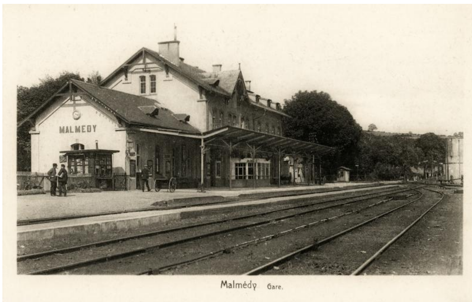
Gare de Malmédy