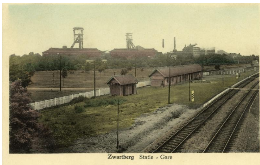
Gare de Zwartberg