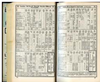
Ligne 21 - Horaire 1937