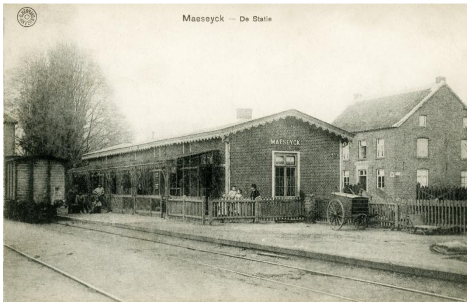
Gare de Maaseik - Maaseik station