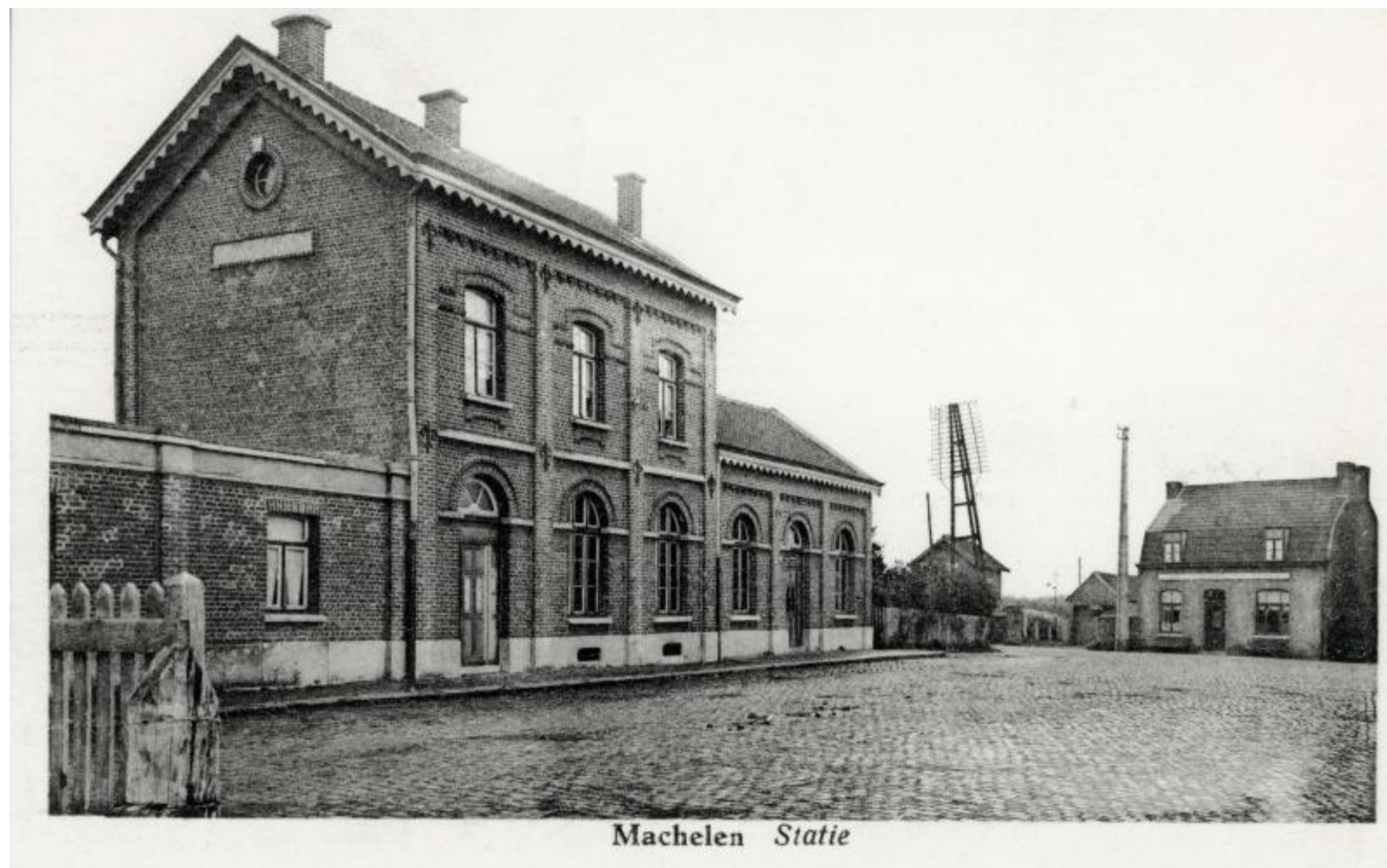
Gare de Machelen