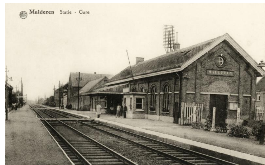
Gare de Malderen - Malderen station