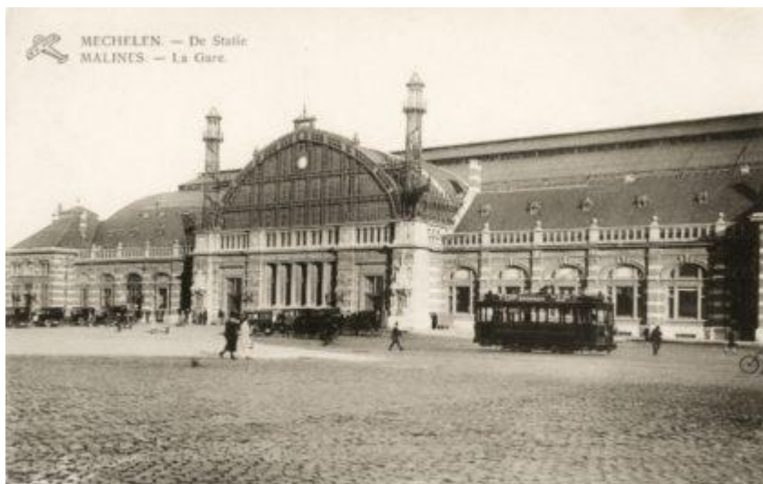
Gare de Malines - Mechelen station