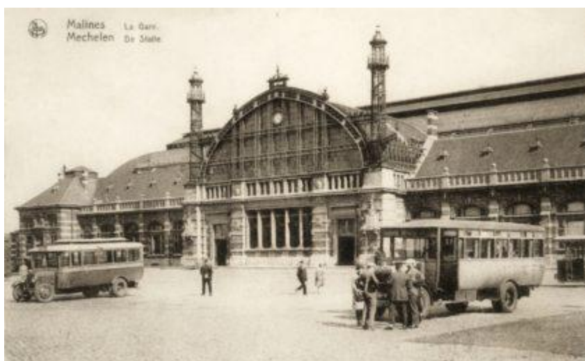
Gare de Malines - Mechelen station