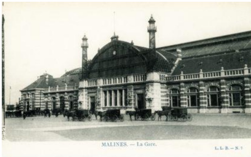
Gare de Malines - Mechelen station