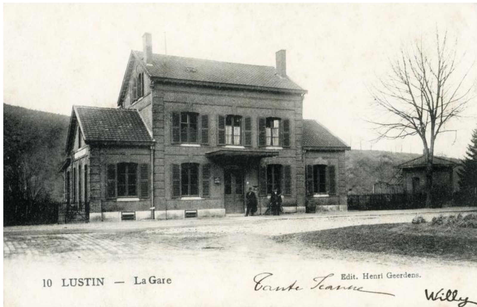
Gare de Lustin