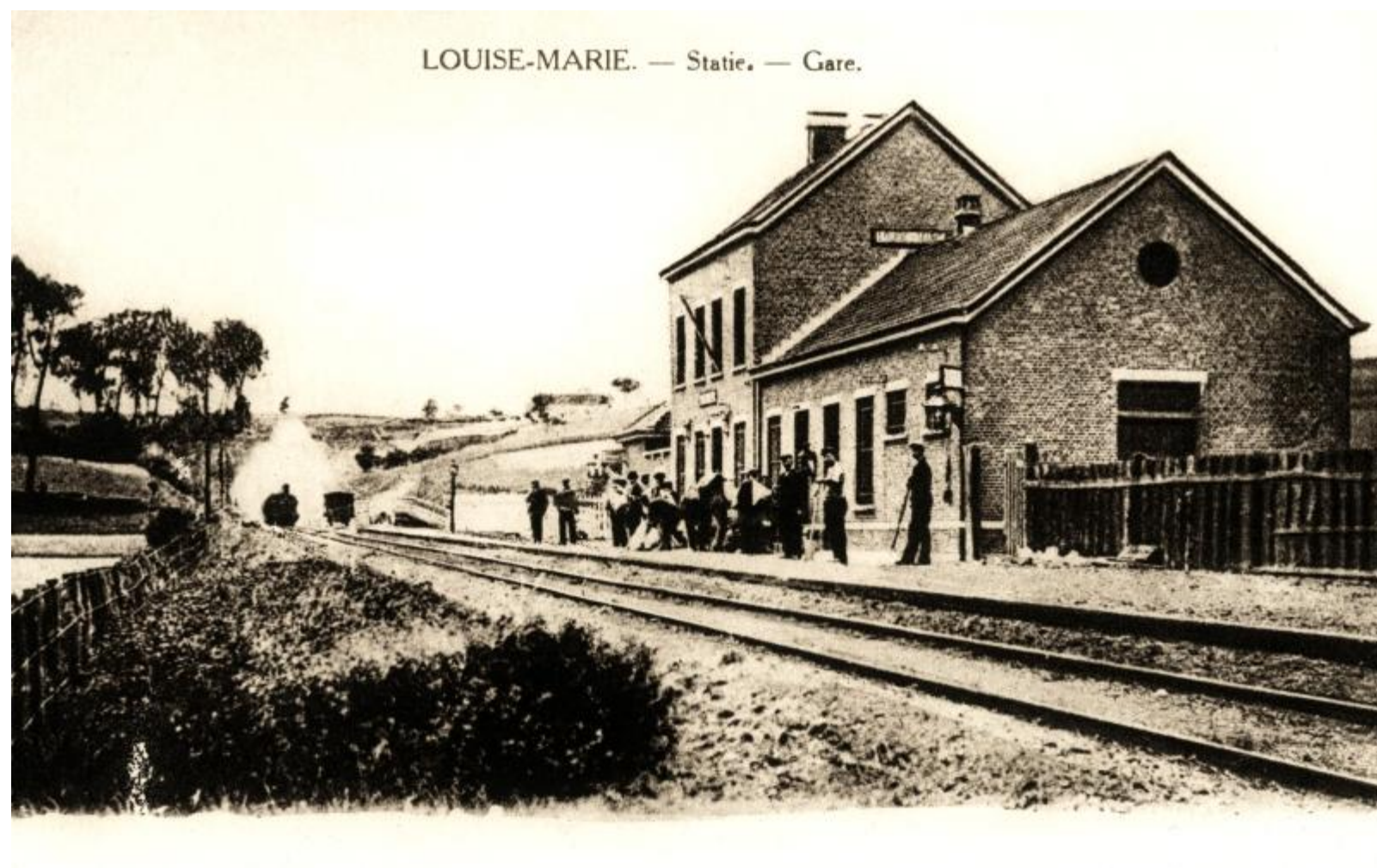
Halte de Louise-Marie