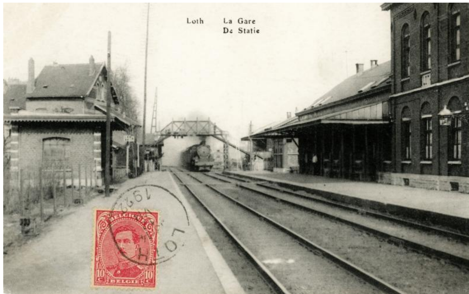
Gare de Lot