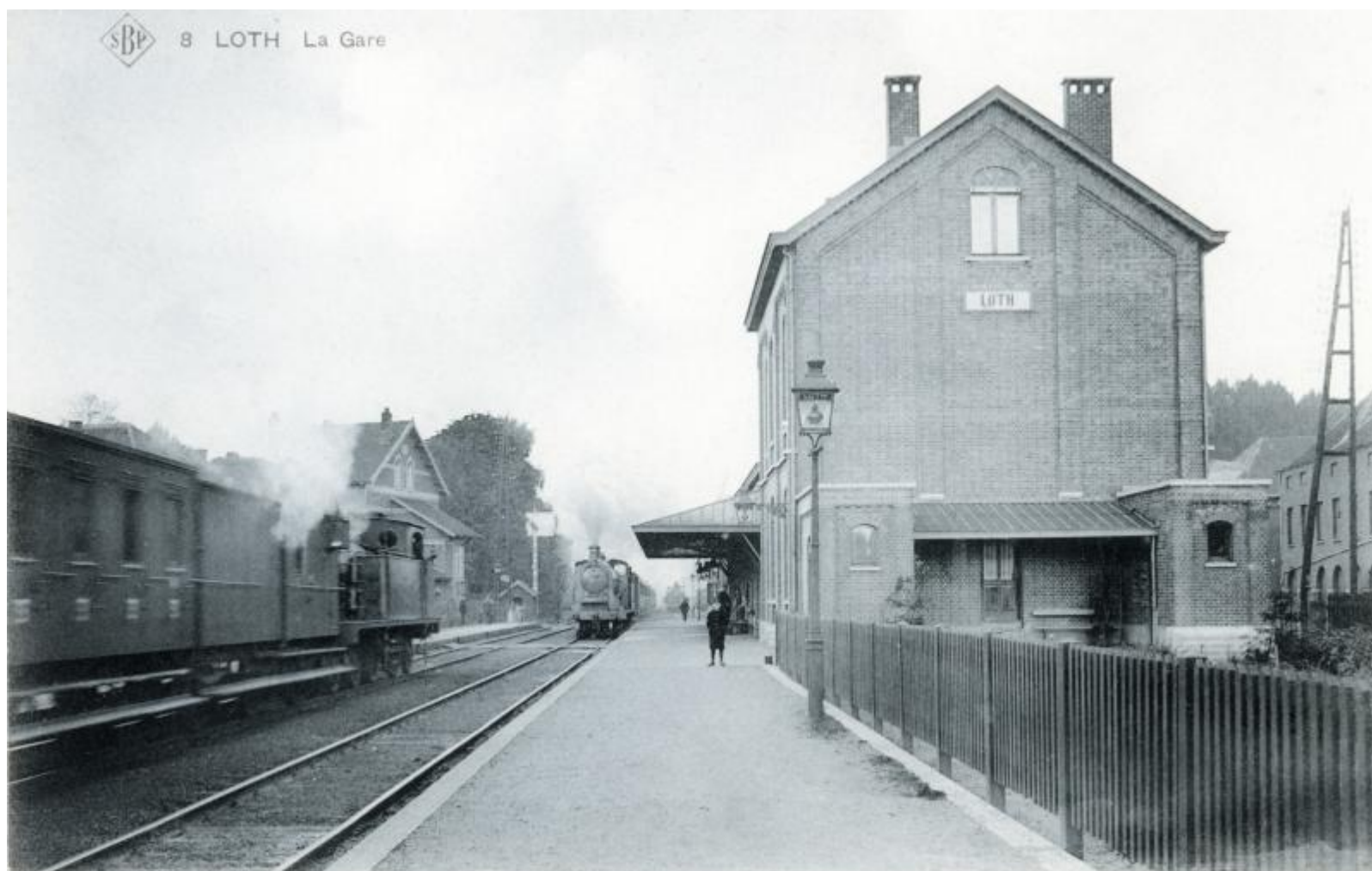
Gare de Lot