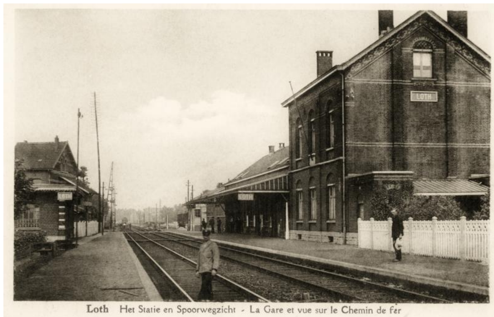
Gare de Lot