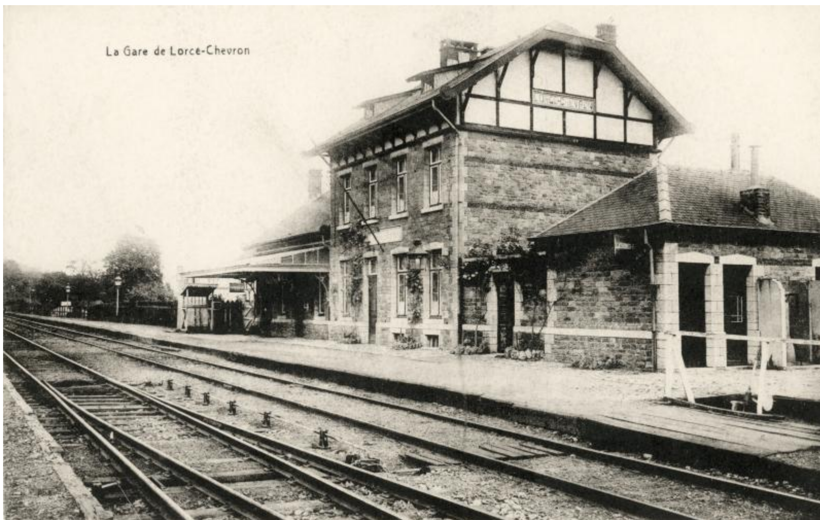
Halte de Lorce-Chevron