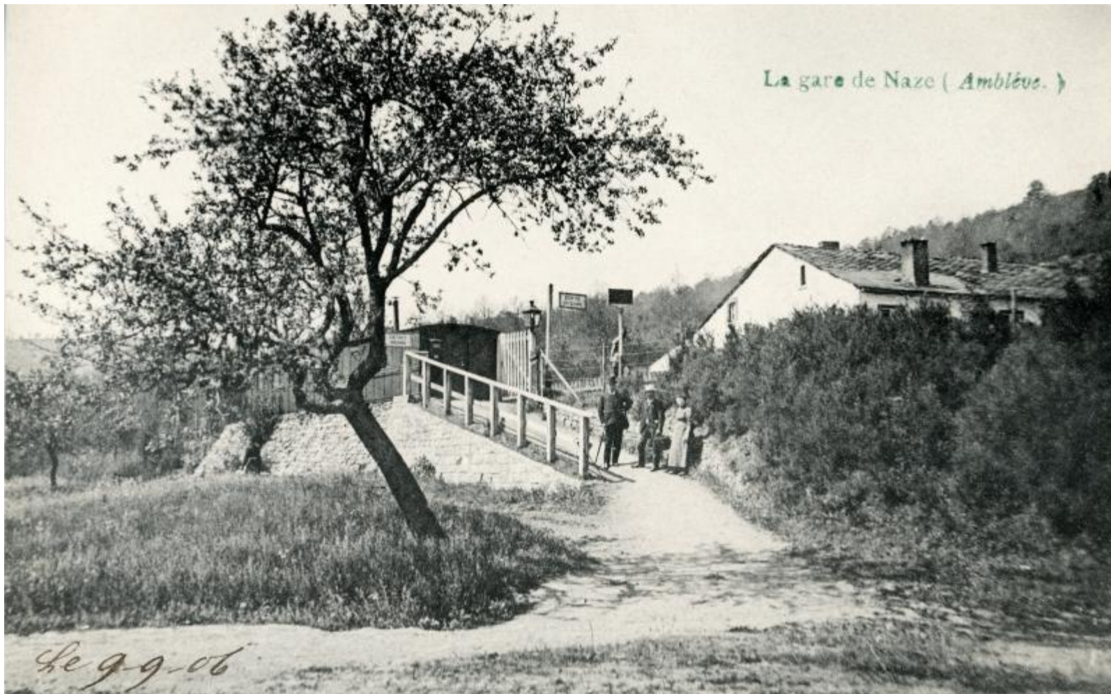
Halte de Naze (Lorce-Chevron)