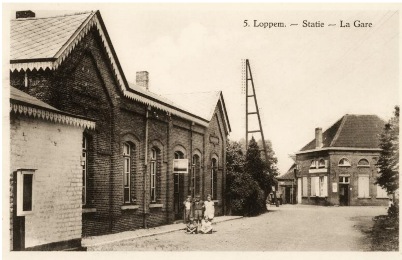
Gare de Loppem - Loppem station