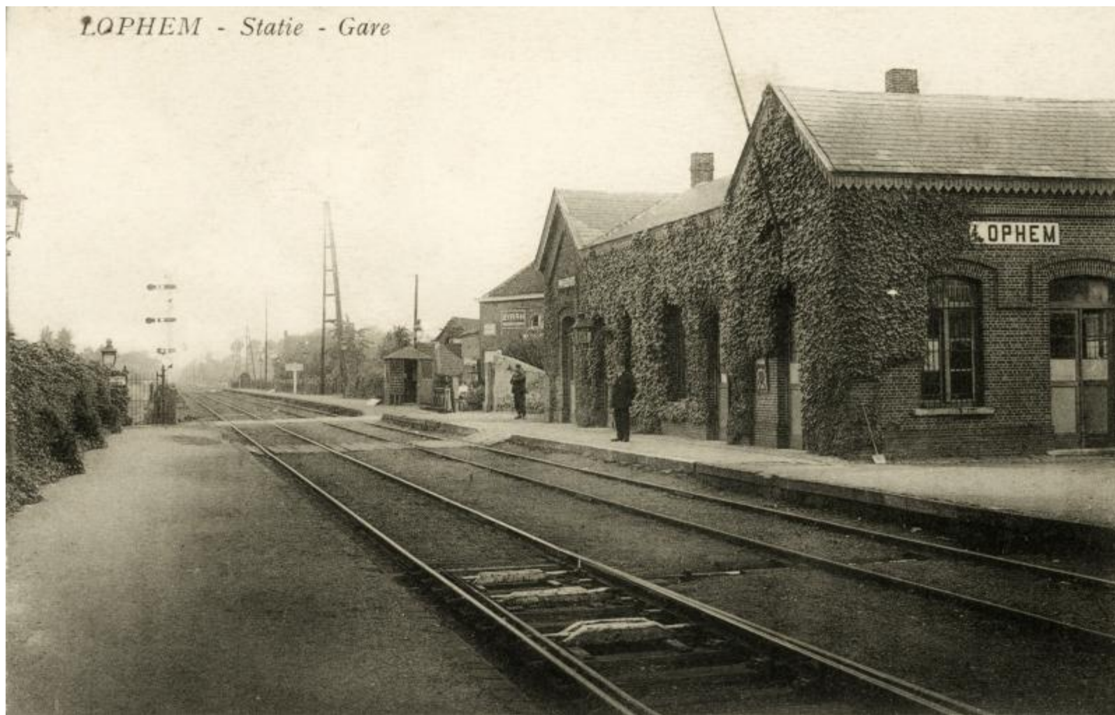
Gare de Loppem - Loppem station