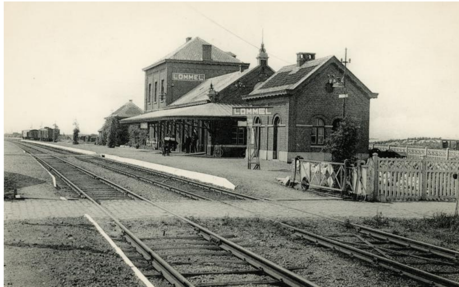
Gare de Lommel