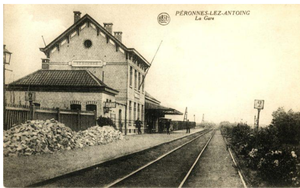
Gare de Péronnes