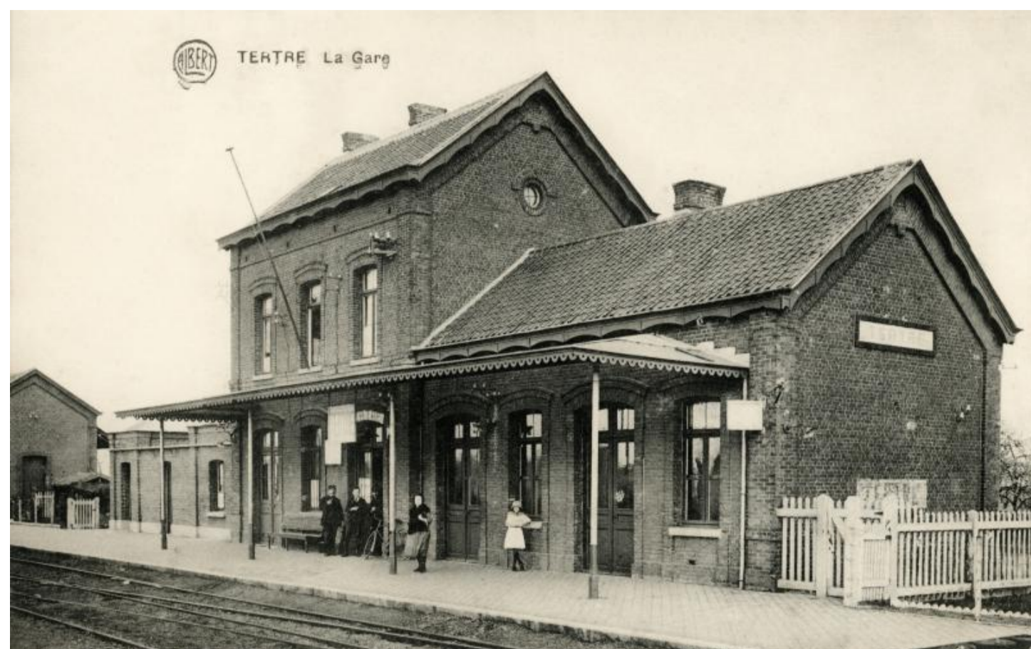
Halte de Tertre

Horaire 1897 : ligne 109 – Vicinal : 237