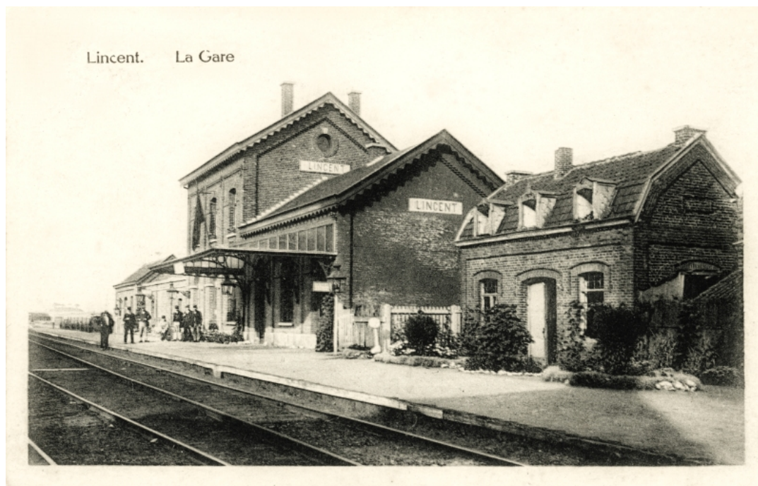
Gare de Lincet