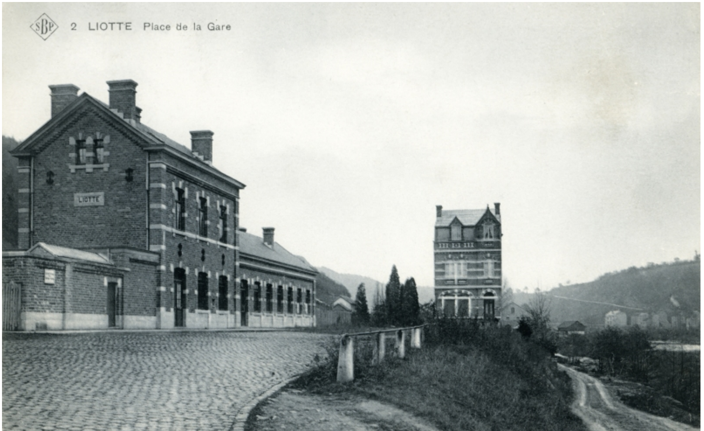
Gare de Liotte