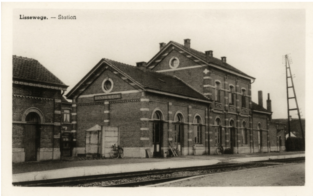
Gare de Lissewege – Lissewege station