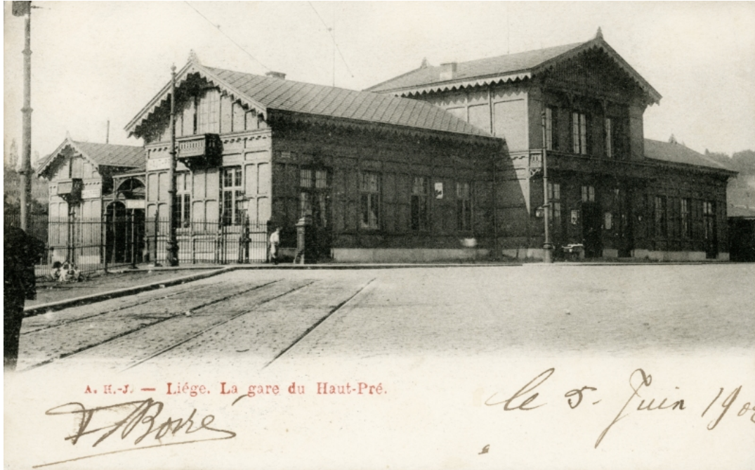
Gare de Liège Haut-Pré