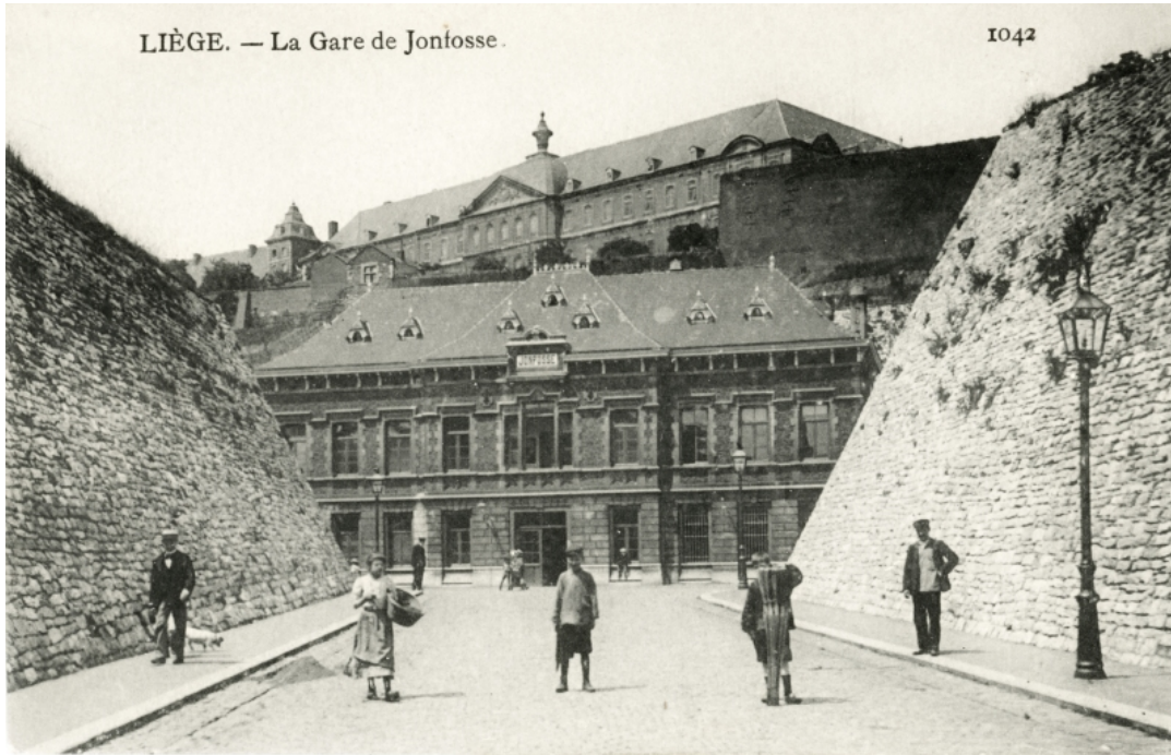
Halte de Liège Jonfosse

Nom actuel : Liège Carré (depuis le 03/09/2018)