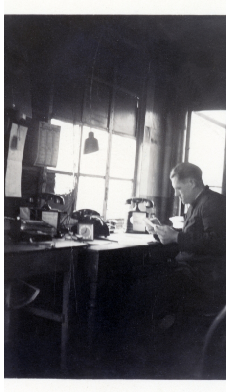
( http://www.railstation.be/wp-content/uploads/2020/06/leignon_7.jpg )