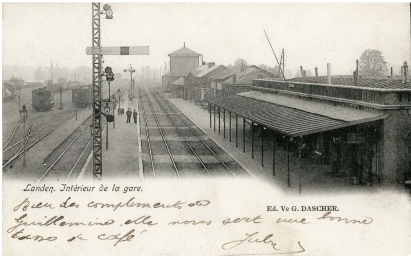
Gare de Landen – Landen station