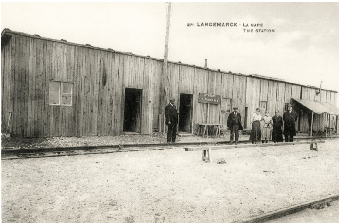
Gare de Langemark – Langemark station

( http://www.railstation.be/wp-content/uploads/2021/01/langemark2.jpg )