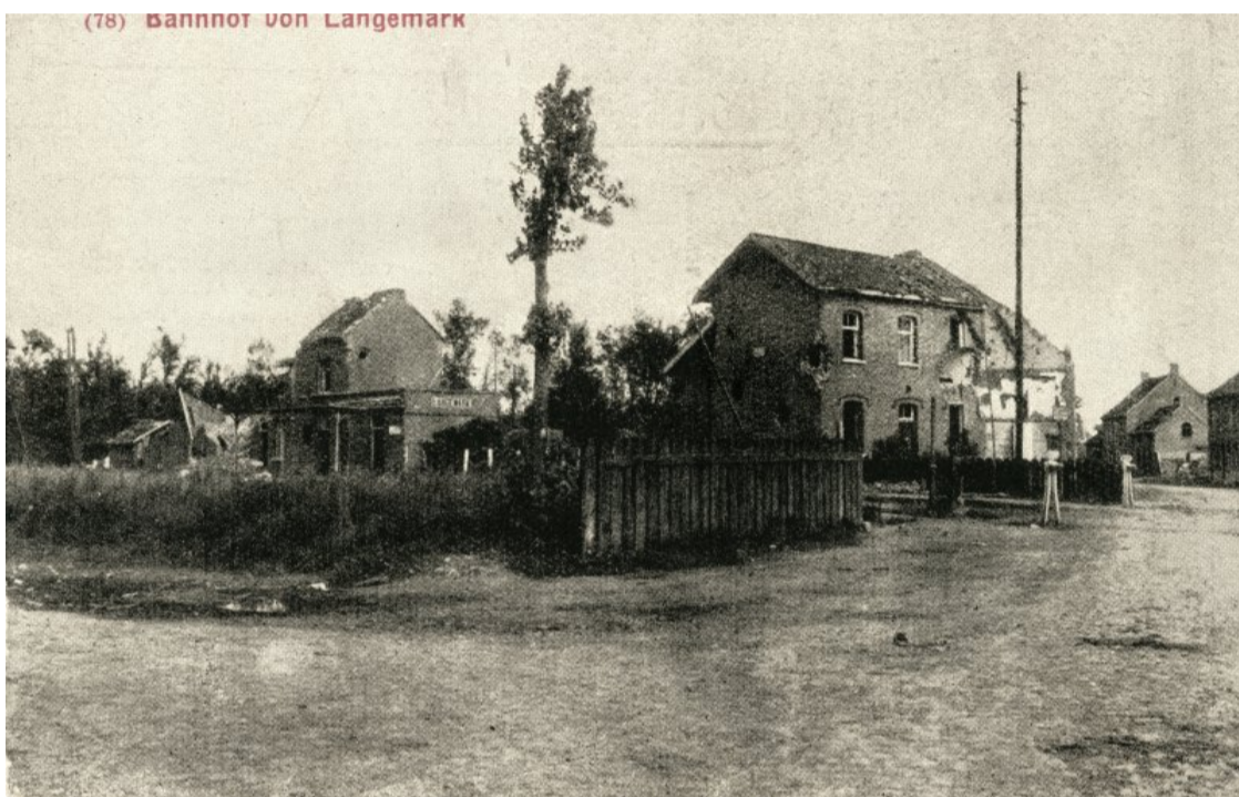
Gare de Langemark – Langemark station

( http://www.railstation.be/wp-content/uploads/2021/01/langemark1.jpg ).