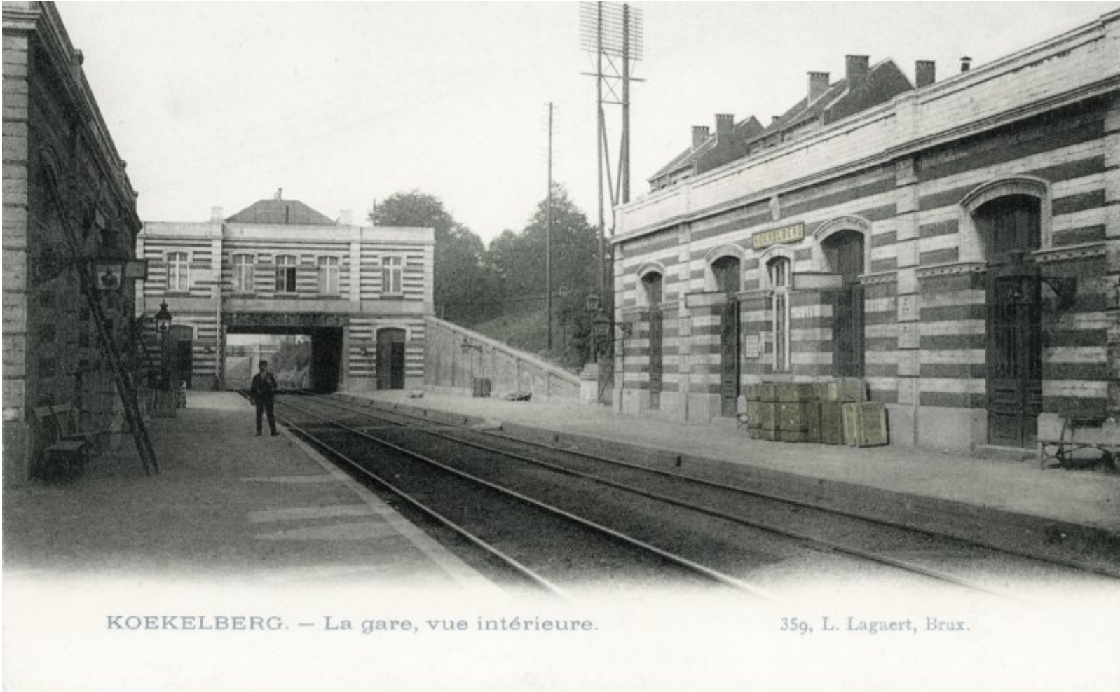
KOEKELBERG. — La gare, vue intérieure.