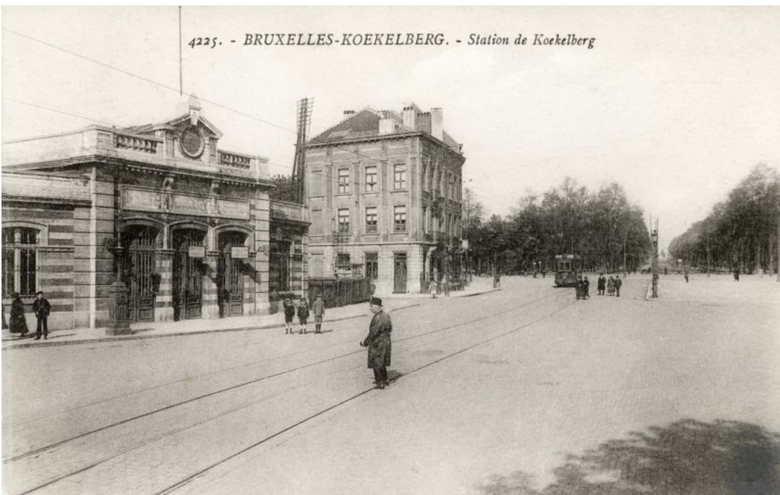
4225. - BRUXELLES-KOEKELBERG. - Station de Koekelberg

( http://www.railstation.be/wp-content/uploads/2022/02/koekelberg2.jpg )