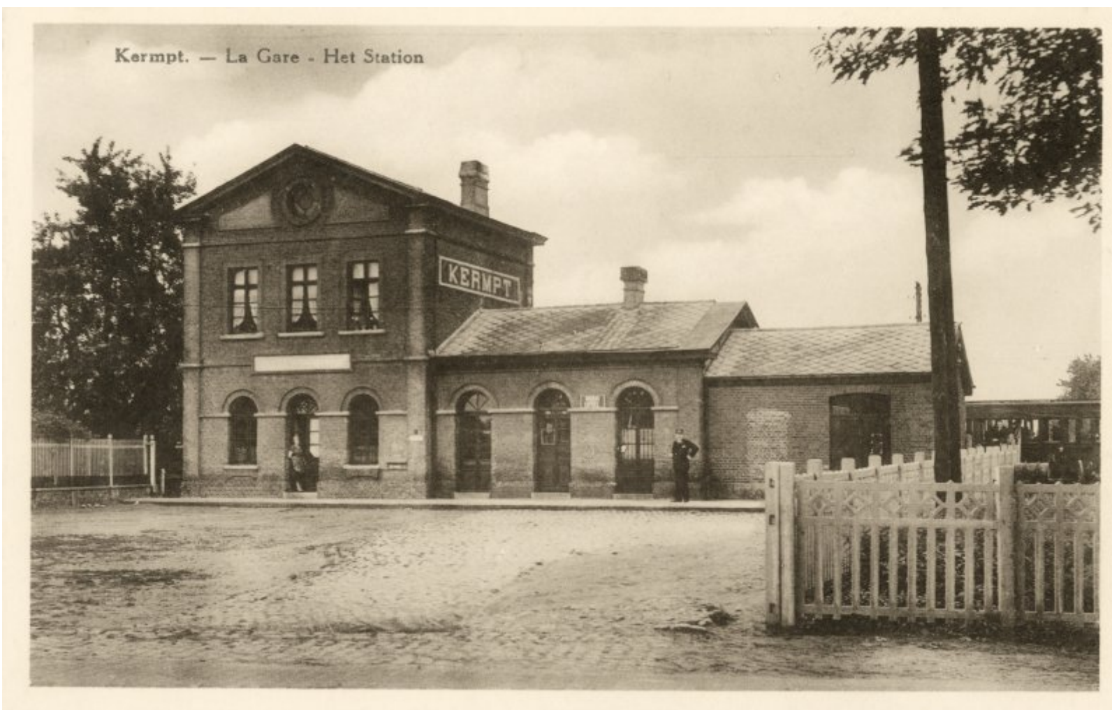
Gare de Kermt – Kermt station