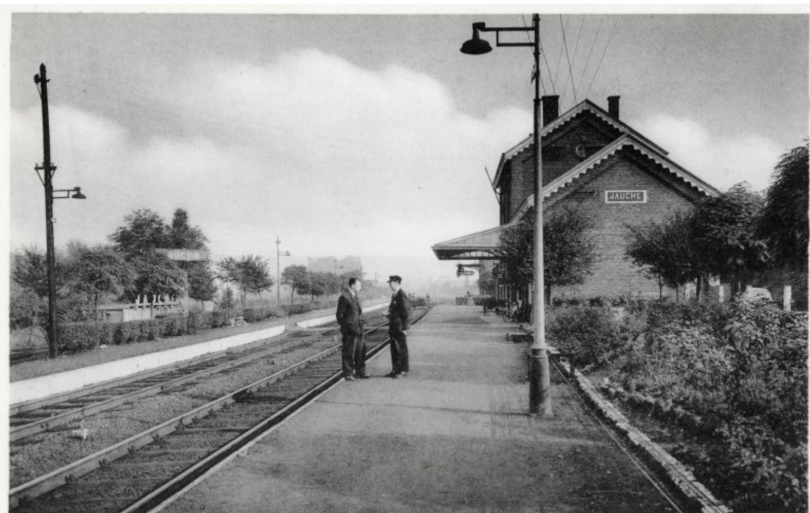
Gare de Jauche