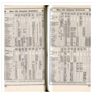
Ligne 90 – Horaires 1937

( https://www.railstation.be/p320-321/ )